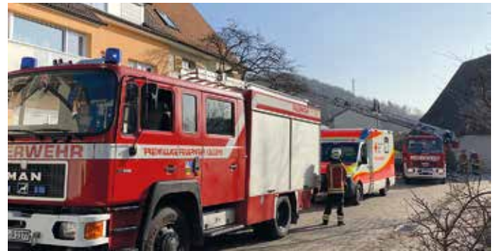
Einsatz am 24.01.2020