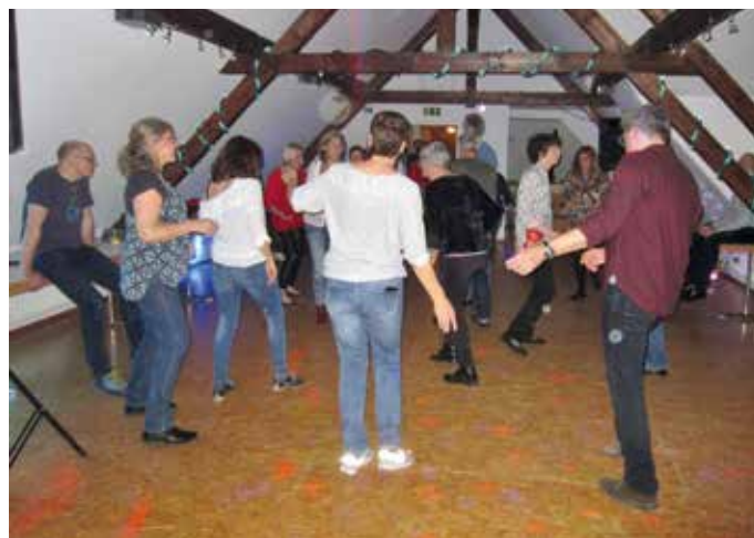
Tanz-Ab in der Villa Kling.

Die nächsten "Tanz-Ab"-Termine sind am am 28. März und 9. Mai jeweils ab 21 Uhr. Wir freuen uns auf viele Besucher