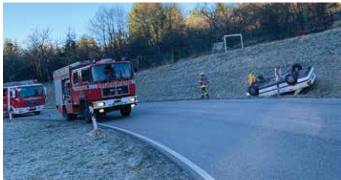
Einsatz am 07.02 im Bereich der S-Kurve

Einsatzauftrag: Verkehrsunfall Einsatzort: Dietlingen, L 562 Alarmierte Einheiten: Tagalarm Dietlingen Fahrzeuge: LF 16/12, HLF 10 Zahl der Einsatzkräfte: 14 Einsatzdauer: 1,0 Stunden