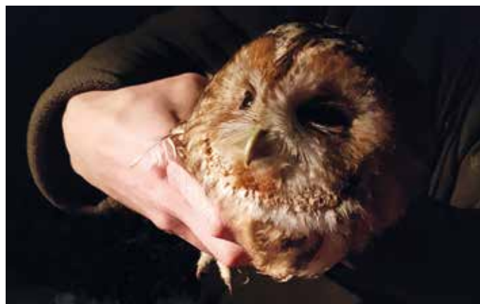
Einsatz Tierrettung am 26.02. in Ellmendingen.

Einsatzauftrag: Tierrettung Einsatzort: Ellmendingen, Wildbader Straße Alarmierte Einheiten: Abteilung Ellmendingen Fahrzeuge: HLF 10, Kdow Zahl der Einsatzkräfte: 7 Einsatzdauer: 1,0 Stunden