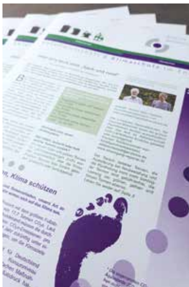
In den nächsten Tagen erhalten alle Haushalte im Enzkreis die neue Ausgabe der Zeitung „Abfallwirtschaft und Klimaschutz im Enzkreis“.

Schwerpunkt im Klima-Teil der Zeitung ist die Energieeinsparung. Die „Stabsstelle Klimaschutz und Kreisentwicklung“ hat zahlreiche Tipps aus den Bereichen Wohnen, Elektrogeräte, Mobilität und Ernährung zusammengestellt, mit denen sich klimaschädliches Kohlenstoffdioxid verringern und auch Geld einsparen lässt.