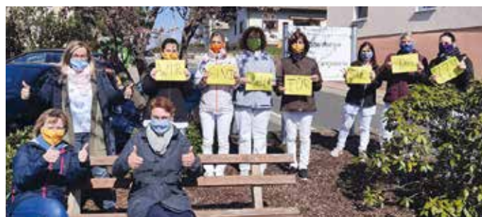
Ein Teil des Teams der Sozialstation Straubenhardt