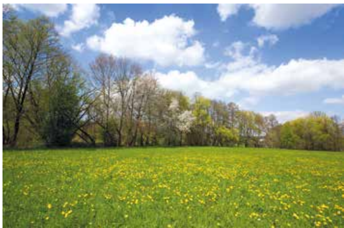
Machen Sie mit beim Fotowettbewerb "Mein Keltern", hier ein Beispielfoto zur Kategorie "Landschaften"

Der Fotowettbewerb hat bereits begonnen und endet am 28. Februar 2022. Die Einsendung der Fotos oder Scans von historischen Motiven erfolgt ausschließlich digital unter folgender Adresse: www.keltern.de/gemeinde-keltern/50-jahre-keltern , hier finden Sie auch die Teilnahmebedingungen und das Anmeldeformular. Falls Sie im Vorfeld noch Fragen dazu haben, können Sie gerne Frau Antje Schultner unter folgender Adresse kontaktieren: a.schultner@gmx.de