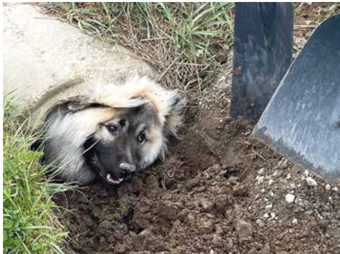
Einsatz am 6. April 2022 in Weiler

Einsatzauftrag: Tierrettung Einsatzort: Weiler, Gayernstraße Alarmierte Einheiten: Tagalarm Weiler Fahrzeuge: HLF 10, LF 16/12, Kdow Zahl der Einsatzkräfte: 15 Einsatzdauer: 1,0 Stunden