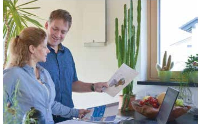
Eine kontrollierte Wohnraumlüftung mit Wärmerückgewinnung sorgt für ein angenehmes Wohnklima und reduziert die Heizkosten.

Räumen. Fenster werden nur kurz zum Lüften der Wohnräume geöffnet, um die Zimmer nicht auskühlen zu lassen. Dabei ist ausreichend Frischluft maßgeblich, um sich wohlfühlen. Zudem schützt ein regelmäßiger Luftaustausch vor Schimmelbildung und Feuchtigkeitsschäden. Komfortabler als regelmäßiges Fensteröffnen ist eine Lüftungsanlage. Sie sorgt stets für frische Luft, und zwar ohne unbehagliches Abkühlen.