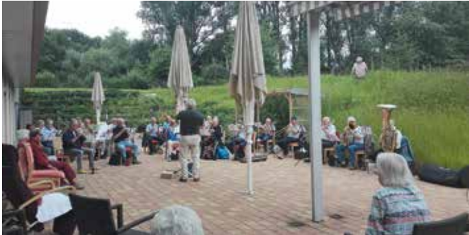
Seniorenbläserkreis Pforzheim Stadt und Land

Es ist schon eine Tradition, dass der Seniorenbläserkreis Pforzheim Stadt und Land, am ersten Mittwoch im August im Seniorenzentrum ein kleines Konzert gibt.