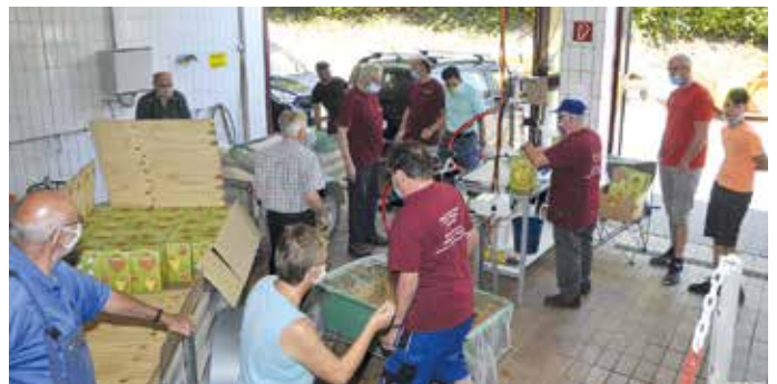
Wie im Vorjahr wird auch für die kommenden Wochen viel Betrieb in der Gemeindemoste erwartet

Eine wertvolle Neuerung ist der extra in der Mostehalle eingerichtete Festnetztelefonanschluss. In den vergangenen Jahren war es oft sehr schwierig, während der Öffnungszeiten das Team für die Terminabsprache zu erreichen, weil dort der Mobilempfang nicht stabil ist. Ab sofort aber ist die Nummer 07236 982 59 11 für die Terminvergabe freigeschaltet und bis zum Mostestart werktäglich zwischen 16:30 und 19 Uhr erreichbar. Ab dem 17. September können dann jeweils zu den Öffnungszeiten telefonisch oder persönlich vor Ort Termine vereinbart werden.