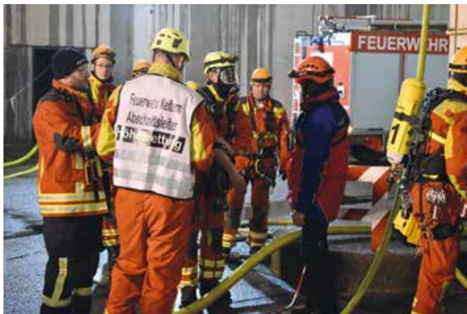
Einsatz der Höhenrettungsgruppe am 29.08.2021 in Neuenbürg

47 Datum / Uhrzeit 29.08.2021 / 21:09 Uhr Einsatzauftrag: Überlandhilfe Einsatzort: Neuenbürg, Turnstraße Alarmierte Einheiten: Höhenrettung Fahrzeuge: MTW Zahl der Einsatzkräfte: 8 Einsatzdauer: 5,00 Stunden