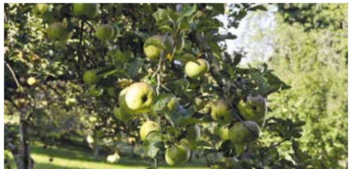
Die Früchte an den Bäumen sind schon fast bereit für die Ernte und Weiterverarbeitung