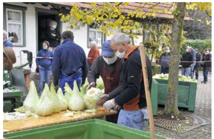
Mit Maske und Abstand: Das Krautschneiden läuft auch unter schwierigen Bedingungen optimal

Das Warten ist recht kurzweilig, weil man der Arbeit des Krautschneidens zusehen und sich daran freuen kann, dass man die großen Kohlköpfe nicht selber mühsam zu raspeln braucht, und belohnt wird es ohnehin: