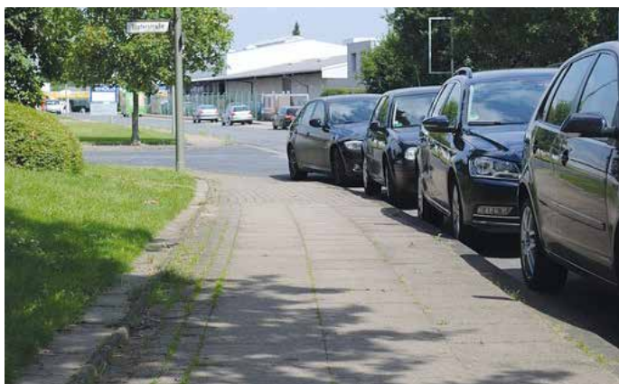
Falschparken mit Behinderung von Einsatzkräften kann teuer werden. Lieber einen weiteren Fußweg in Kauf nehmen!

Das Parken von Fahrzeugen auf Durchgangs- und Anwohnerstraßen wird immer mehr zum Problem und zur Belastung von Nachbarschaften. Wird auch noch Rettungsdienst oder Feuerwehr durch Falschparker beim Einsatz behindert, kann diese Gedankenlosigkeit Menschenleben oder auch Eigentum gefährden. Auch die Entsorgungsunternehmen teilen immer häufiger mit, dass Mülleimer nicht geleert werden können, weil eine Einfahrt in zugesperrte Bereiche nicht möglich ist.