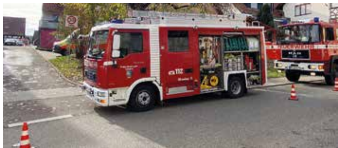
Einsatz 24. Oktober 2022 in Weiler

61 Datum / Uhrzeit 24.10.2022 / 14:34 Uhr Einsatzauftrag: Unterstützung Rettungsdienst Einsatzort: Weiler, Obere Dorfstraße Alarmierte Einheiten: Tagalarm Weiler Fahrzeuge: HLF 10, LF 16/12 Zahl der Einsatzkräfte: 13 Einsatzdauer: 1,0 Stunden