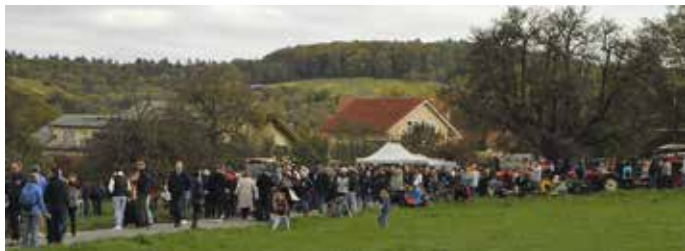
Kaum ist der November da, sind die Temperaturen gefallen; der Himmel ist bedeckt und der Wind weht frisch, aber das kann die vielen Besucher des Weideabtriebs nicht abschrecken

Für die menschlichen Gäste des Weideabtriebs ist am Rastplatz ebenfalls bestens gesorgt. Der Arbeitskreis Heimatpflege und Kunst e. V. bietet, wie es Tradition ist, wieder herzhaftes Rindswürstle an, dazu Hefezopf und Getränke. Ein bisschen frisch ist es geworden, der Wind bläst zuweilen kräftig und die Sonne zeigt sich an diesem ersten Novembertag nur selten. Da freut sich so mancher über den wärmenden Glühmost. Abschreckend wirkt das Wetter jedenfalls nicht: Mehrere hundert Besucher wollen sich das traditionsreiche Ereignis nicht entgehen lassen und bevölkern die Wiesen um den Niebelsbacher Weg. Auch die Güldnerfreunde Remchingen und die Schlepperfreunde sind wieder mit ihren Traktoren und Holder-Einachsschleppern gekommen und zeigen sie gerne den interessierten großen und kleinen Besuchern. Wer mag, darf sogar mal auf den Fahrersitz klettern und sich wie ein richtiger kleiner Landwirt fühlen. Der Wind lädt einige Kinder dazu ein, nebenan auf der abgemähten Wiese Drachen steigen zu lassen. Und die Kleinsten sind begeistert von den Kühen, Eseln und Ziegen, die vom Trubel völlig unbeeindruckt weiden.