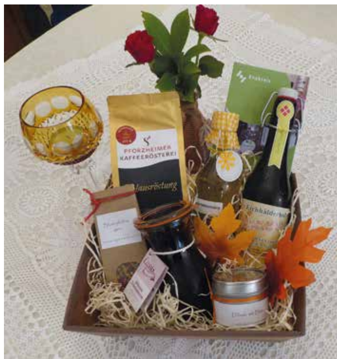
Die „Enzkreis-Genusskiste“ kann aus einem reichhaltigen Angebot an regionalen und fair gehandelter Produkte individuell bestückt werden.

Angesichts der Corona-Pandemie und des Ukraine- Krieges wird vielen Menschen bewusst, wie wichtig eine gesicherte Versorgung mit Lebensmitteln ist. Voraussetzung hierfür ist der Erhalt landwirtschaftlicher und lebensmittelverarbeitender Betriebe in der Region.