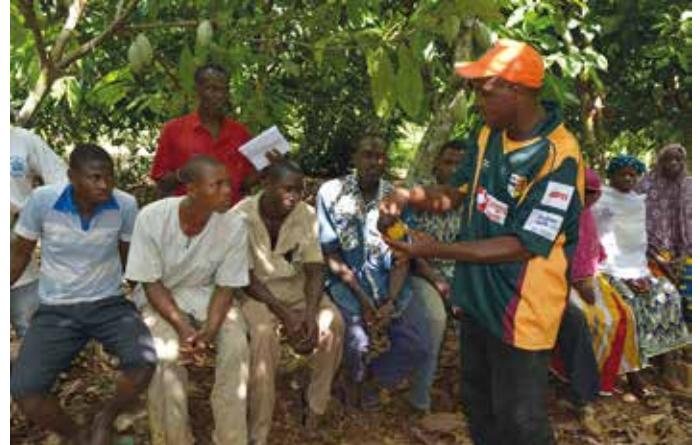
Mitglieder der Fairtrade-zertifizierten Kakao-Kooperative ECOOKIM von der Elfenbeinküste.