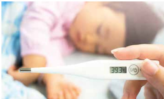
Viele Kinder trifft die aktuelle Infekt-Welle. „Nicht immer gleich zum Arzt“, raten Gesundheitsamt und Kinderärzte aus der Region